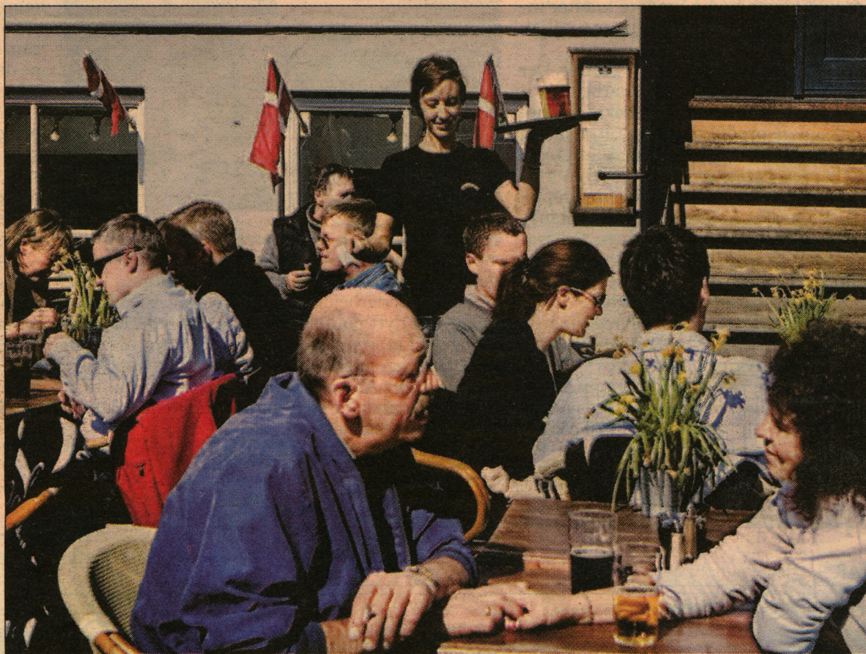
Solskinnet er gratis i Nyhavn, men ellers er priserne på menukortet 21 pct. højere end i andre lande.