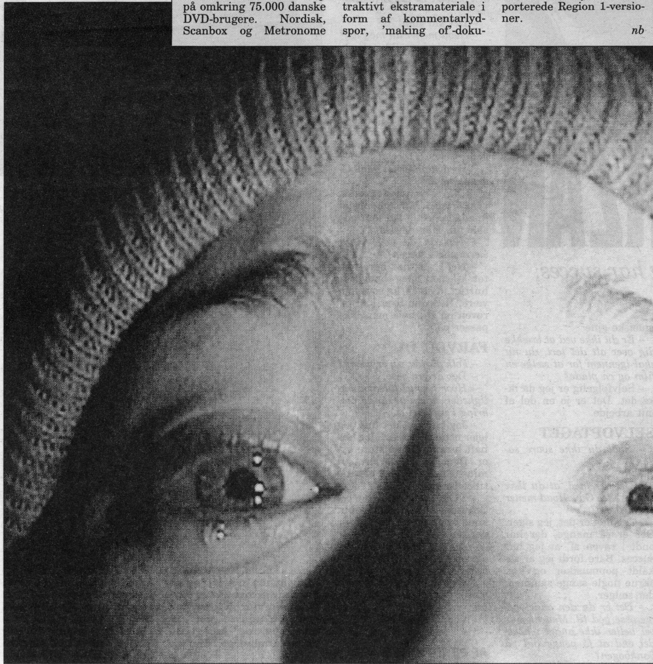
I 'The Blair Witch Project' gennemlever skuespillerne selv de rædsler, som filmen skildrer.