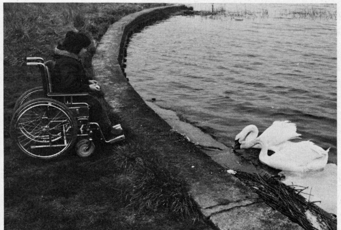
Filmen »Solstref« handler om en dreng i rullestol. Denne film har vundet flere priser ved amatørfilmstævner.