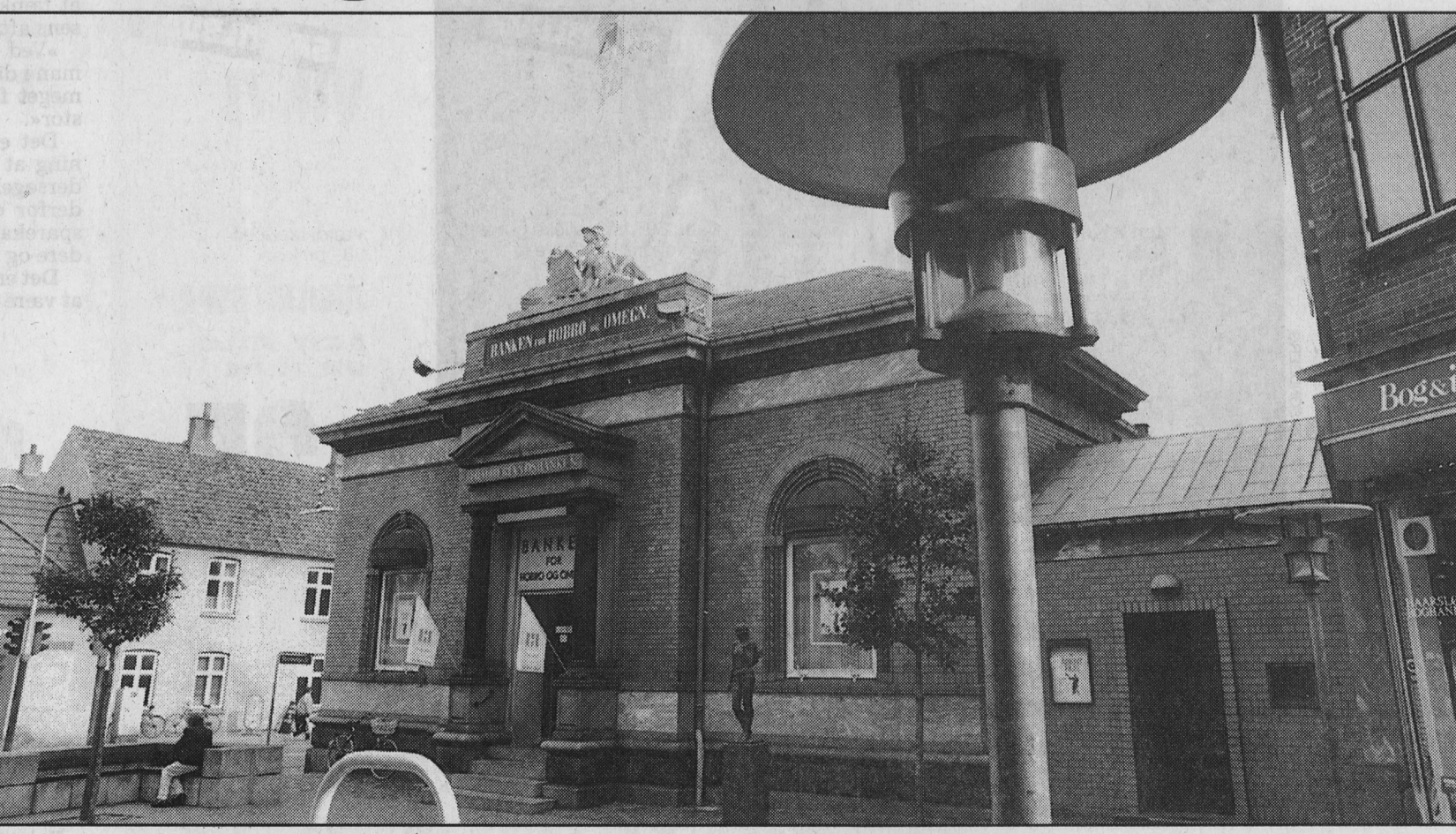
Danmarks mest omstridte pengeinstitut siden august 1993: Himmerlandsbanken i Hobro for Spar Nords skilt blev sat på facaden.

...hvorimod vi andre blev afhørt under sædvanligt vidneansvar. Faktum er, at vi ændrede ikke betingelser, undnyttede ikke situationen, og jeg blev ikke underkendt overhovedet. Men hvordan skal befolkningen - sparekassens kunder eller andre vide det, når topembedsmænd fra Told og Skat siger det modsatte i retten? Michelsen siger i en aforsime: »Uslingens bedste våben har altid været fejhed«. Heldigvis fik vi bekræftet sparekassens forklaring gennem udsagnene fra især Finanstilsynets og Industriministeriets embedsmænd samt de neutrale vidner fra Himmerlandsbanken. Og så lidt om fremtiden - læren af denne sag. Hvor mange skatteborgere/virksomheder har fået en tilsvarende uretfærdig behandling, men har givet op, fordi de ikke har haft kræfter - økonomisk, mentalt og organisatorisk - til at stå fast og gå op imod den del af embedsmændene, der sætter egen person over moral og retfærdighed. Går enevældens embedsmænd fortsat levende rundt blandt os? Allerledes den dag, vi fik regerings tilbud om fri proces til en retssag, sagde vi: »Hvis danske virksomheder skal indgå aftale med det offentlige, bør der være flere høje retssagførere til stede som vidner.«