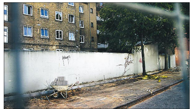
"BERLINMUREN" FØR arbejdet gik i gang.