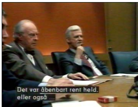
FDV's tilladte VHS-udgave